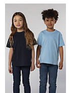
SOL'S Imperial KIDS 11770